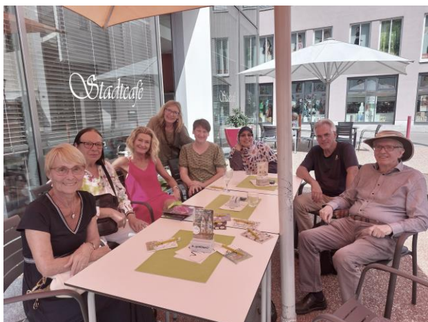
hauptamtlich und freiwillig Engagierte im MGT-Team

Haben Sie Fragen oder Probleme mit Ihrem Smartphone, Tablet, Laptop oder PC? Brauchen Sie Hilfe bei Einrichtung u. Bedienung, Beratung zu Software oder Apps? kostenlose Beratung, auch online möglich. Terminvereinbarung notwendig.