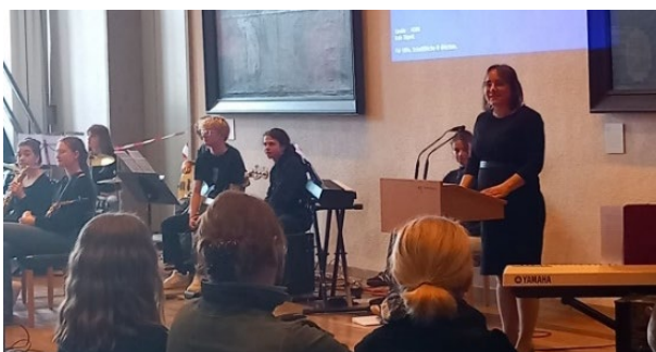
Eröffnungsfeier der Aktionswoche am 20.11.2023

Am 20. November ist der Internationale Tag der Kinderrechte. An diesem Tag wurde die Kinderrechtskonvention von den Vereinten Nationen verabschiedet. Rund um diesen Tag finden alljährlich Aktionen mit und für Kinder statt, um die Kinderrechte weiter zu verankern.