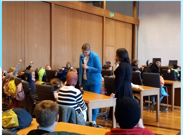
Kindersprechstunde am 22.11.2023 im Sitzungssaal des Rathauses